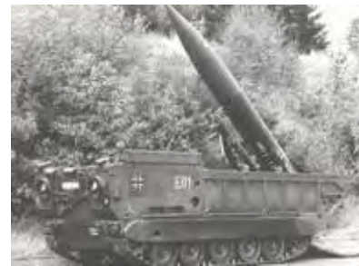
Waffensystem Lance (1979 - 1993)