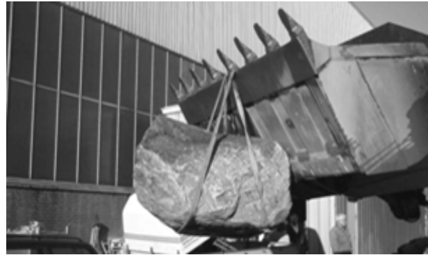
Schwere Last am Haken

Die heute noch im Freien stehenden Erinnerungstücke des Bataillons sollen in einem Raketengarten einen würdigen Platz finden. Die Bauarbeiten sollen Anfang des Jahres beginnen.