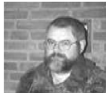
Major Barlag 2001

Am 31.01.1994 wurde er zum Major befördert.