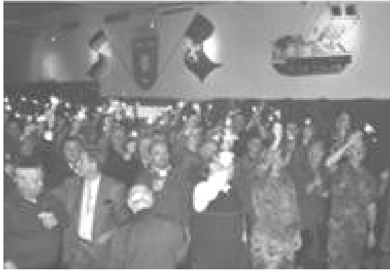
Wunderkerzen beim Einzug der Barbara

Ich sage die Barbara des Jahres 2001 an und so ergibt es sich, daß die erste Barbara der Kaserne der letzten Barbara das Mikrofon übergibt. Eine denkwürdige Dramaturgie, die mir unter die Haut geht.