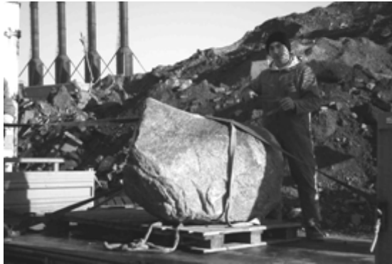
Ein schönes Stück