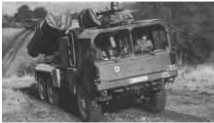
Waffensystem LARS (1993 - 1998)