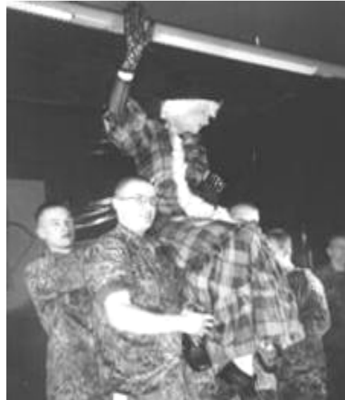
Zum Lobe und Ruhme der lieblichen Jungfrau

Nochmals - und an dieser Stelle ist das Lied angebracht und geht unter die Haut - erklingt "Time To Say Good-Bye" und mit dem alten Song "Show Must Go On" verabschiedet sich das Barbara-Ensemble 2001 von seinem Publikum.