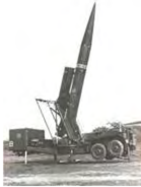
Waffensystem Sergeant (1963-1979)