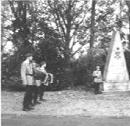
Kranzträger und Ehrenwache am Ehrenmal des IR 2