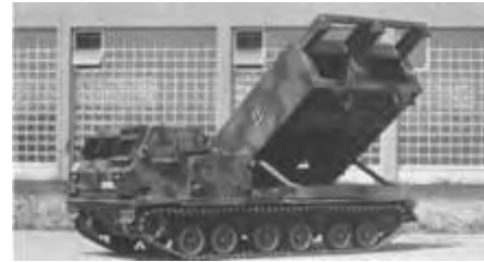
Waffensystem MARS (1993 - heute)