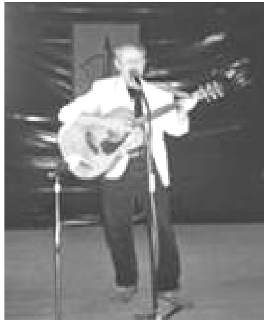
Ein altes Barbara-Schlachtroß in Aktion