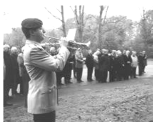
" Ich hatt' einen Kameraden "