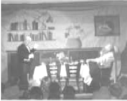
Dinner For One / Commanders Dinner