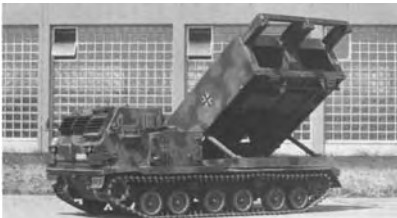
MARS-Werfer in Stellung

Für 2001 seien nur einige Ausbildungshöhepunkte in chronologischer Abfolge erwähnt.