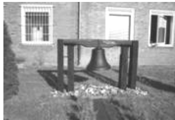
Die Friedensglocke der 3./150

gemäß der Inschrift: "Mein Schweigen heißt Frieden" sollte die Glocke von Stunde an auch bei kommenden Generationen in erhabener Stille den Frieden anmahnen.